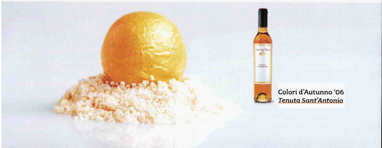
Coleri d'Autunno '06 Tenuta Sant'Antonio